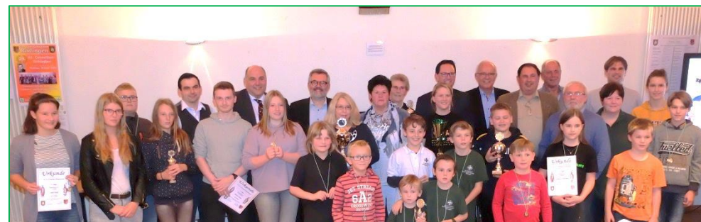
Bild der Siegerehrung 2018

Montag 30. September bis Donnerstag 03. Oktober. 2019