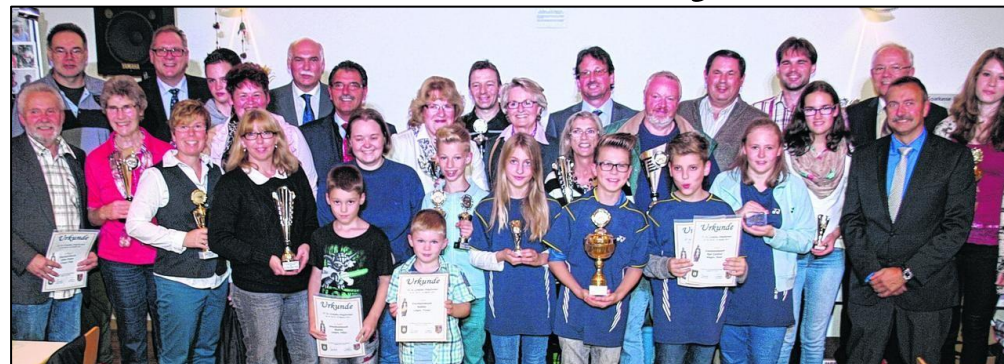
Bild der Siegerehrung 2014