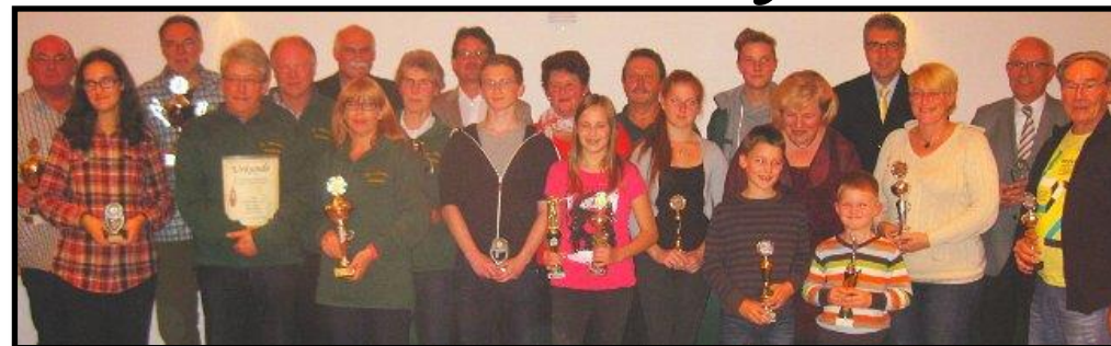
Bild der Siegerehrung 2015