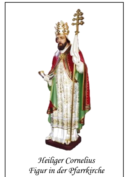
Heiliger Cornelius Figur in der Pfarrkirche