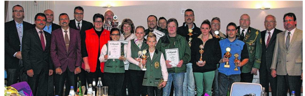
Bild der Siegerehrung 2013

So. 05. Oktober 2014 Lichtgewehr-Schießen Mo. 06. bis Fr. 10 Oktober 2014 Siegerehrung am So. 12.10.2014 ab 19:00 Uhr