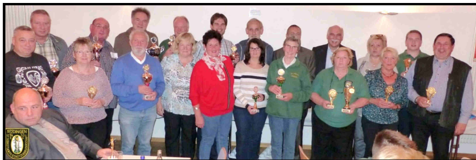
Bild der Siegerehrung 2016

Wir bedanken uns bei allen Spendern, Helfern und Teilnehmern.